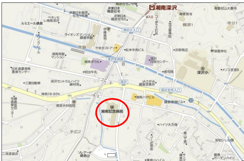
湘南記念病院 院内マップ ⑧ 在宅診療部(4/1～)